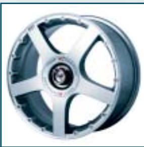
63 TSW Eurace

Preis: 175 bis 202 Euro Größen: 7,5x16 bis 9,5x18 Zoll Für: Audi, VW Telefon: 071 41-6 88 88-0 www.evotech.de