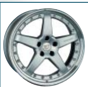
78 Hamann PG3

Preis: 815 bis 894 Euro Größen: 8,5x18 bis 10x18 Zoll Für: Mercedes Telefon: 00 41-56-4 91 29 35 www.fab-design.com