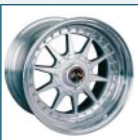
57 Wagner Tuning Touring

Preis: 385 bis 510 Euro Größen: 7x16 bis 10x16 Zoll Für: alle Fahrzeuge Telefon: 03 49 01-678 19 www.wagner-tuning.de