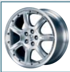
61 J Nothelle JN Exedra II

Preis: 716 bis 1049 Euro Größen: 8,5x18 bis 11x19 Zoll Für: BMW Telefon: 077 71-52 70 www.breyton.de