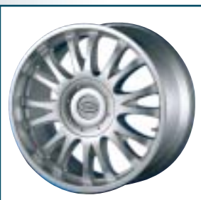
80 Cobra Sahara

Preis: 900 Euro Größe: 8,5x19 Zoll Für: Audi Telefon: 08 41-9 81 88-0 www.mtm-online.de