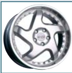
62 Evotech LM

Preis: 568 bis 889 Euro Größen: 8,5x19 bis 9,5x19 Zoll Für: Audi, Jaguar Telefon: 020 65-96 01-0 www.jnothelle.com