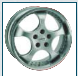
76 Autec Zyklon

Preis: 710 bis 1240 Euro Größen: 8,5x18 bis 11,5x19 Zoll Für: Porsche Telefon: 0 71 52-9 79 90-0 www.gemballa.com