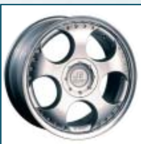
58 JE Design Visage

Preis: 385 bis 510 Euro Größen: 7x16 bis 10x16 Zoll Für: alle Fahrzeuge Telefon: 03 49 01-678 19 www.wagner-tuning.de