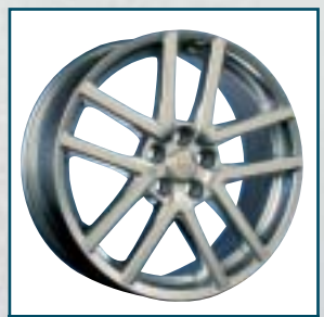
72 Arden Sportline

Preis: 249 bis 269 Euro Größen: 8,5x17 bis 10x17 Zoll Für: alle gängigen Fahrzeuge Telefon: 0 61 26-60 81 www.bcw-felgen.de