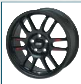
69 Toyota Motorsport GT-One

Eine klare Kunststoffbeschichtung schützt den Glanz. Hält das reparierte Rad den Luftdruck, kann es an den Kunden ausgeliefert werden