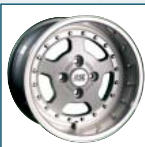
59 RSL Cult-Wheel

Preis: 299 bis 689 Euro Größen: 7,5x17 bis 10x18 Zoll Für: Audi, Seat, Skoda, VW Telefon: 071 31-20 38 40 www.je-design.de