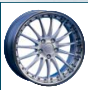
60 Breyton Magic Racing

Preis: 169 bis 219 Euro Größen: 7x13 bis 8,5x15 Zoll Für: VW Telefon: 071 21-5 47 00 www.cult-wheels.de