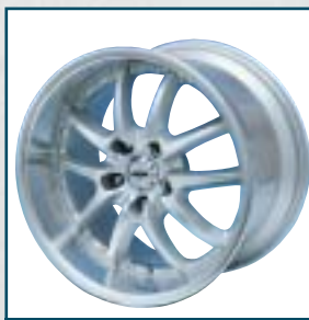
71 BCW Meta

Preis: 603 Euro Größe: 8x19 Zoll Für: Saab 9 e , 9 3 Telefon: 00 41-71-2 74 22 28 www.hirsch-performance.ch