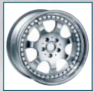
74 Schmidt Technik P 174 198

Preis: 219 bis 500 Euro Größen: 8x17 bis 8,5x19 Zoll Für: alle Autos Telefon: 0 21 02-48 08-0 www.hoelzel-automotive.de