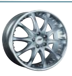
77 FAB Design S-10

Preis: 815 bis 894 Euro Größen: 8,5x18 bis 10x18 Zoll Für: Mercedes Telefon: 00 41-56-4 91 29 35 www.fab-design.com