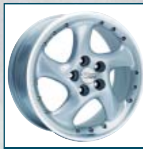
73 emotion Wheels Turbo 2

Preis: 528 bis 578 Euro Größen: 8x18 bis 8x19 Zoll Für: Jaguar Telefon: 0 21 51-37 23-0 www.arden.de