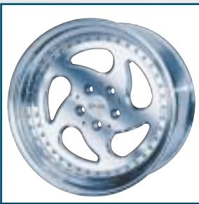
64 Car Line Tuning CM6

Preis: 143 bis 283 Euro Größen: 6,5x15 bis 8x18 Zoll Für: alle gängigen Fahrzeuge Tel: 0 62 52-7 00 60 www.tsw-alurad.de