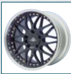
75 Gemballa Racing

Preis: 680 bis 1100 Euro Größen: 8,5x19 bis 11x19 Zoll Für: BMW, Porsche Telefon: 0 61 31-62 53 05 www.schmidt-tech.de