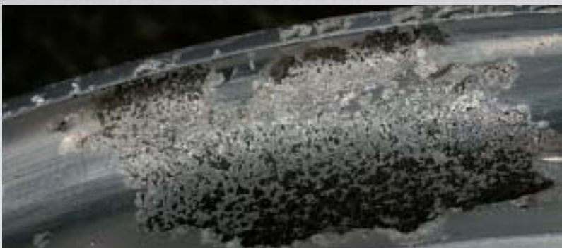
Korrosion: Streusalz und aggressiven Reinigern sind viele Lacke nicht gewachsen

Mit einer Messuhr wird das Rad auf Rundlauf kontrolliert. Röntgen- oder Penetrierverfahren zeigen kleinste Risse nach der Rückverformung