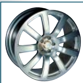
79 MTM Iphestos

Preis: 1022 bis 1660 Euro Größen: 8,5x19 bis 10,5x22 Zoll Für: BMW, Ferrari, Porsche Telefon: 0 73 05-96 08-0 www.hamann-motorsport.de