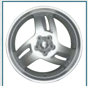
70 Hirsch Performance HP2

Preis: 375 Euro Größe: 8x18 Zoll Für: Lexus IS, Avensis Verso Telefon: 0 22 34-1 82 36 91 www.tte.de